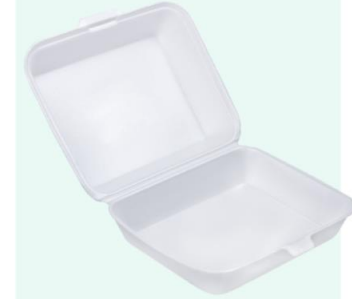
Foam food container