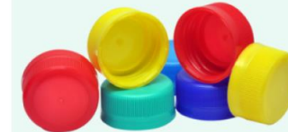
Loose bottle caps