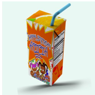
Karton po soku