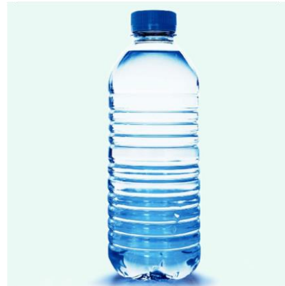
Butelka z tworzywa PET