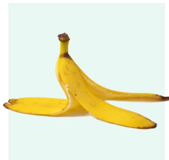
Skórka od banana