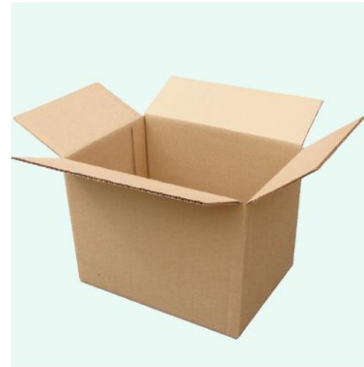
Pudełko z tektury