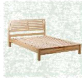
Estrutura da cama de madeira