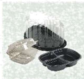
Embalagem de alimentos