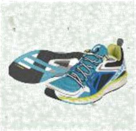
Tênis de corrida