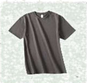
Camiseta de algodão