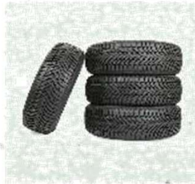
Pneus do carro